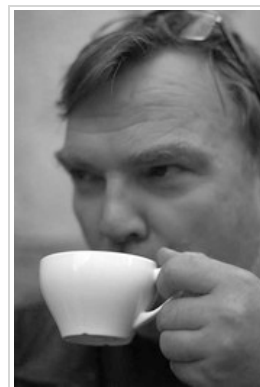
Morgenkaffe — Kaffe skal være varm som et helvete, svart som djevelen, ren som en engel og søt som kjærlighet. ( C.M. de Taeyrand-Périgord)