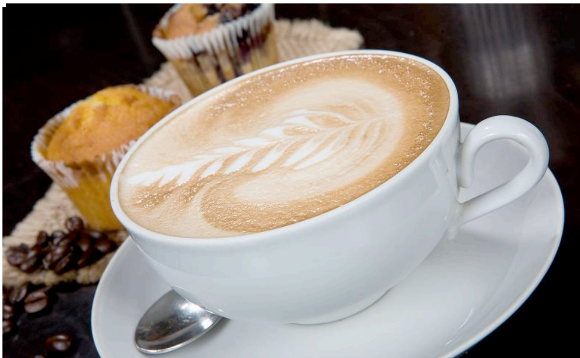
Kaffe og muffins kan redde humøret en trist morgen.