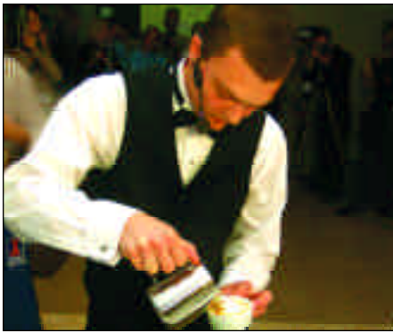
3. Make the perfect cappuccino 3. Prepare el capuchino perfecto