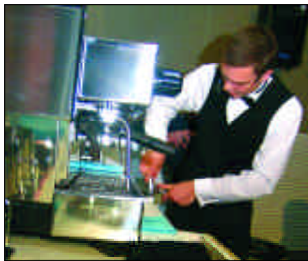
1. Make the perfect espresso 1. Preparar el espresso perfecto