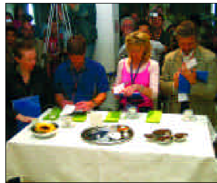
2. Impress the judges! 2. ¡Impresione a los jueces!

which he roasts and blends the espresso coffee sold by the chain – nearly the same blend he used in winning the WBC in Trieste. “The blend,” he says, “is 100% arabica, based on a Brazilian natural, which is a very sweet and ‘rested’ coffee. Then there’s a lot of sweet El Salvadorian coffee, and some Colombian coffee, and then some coffee from Java, Kenya and Ethiopia to sort of spice up the blend. It’s very fruity flavoured and sweet, with an acidic touch. It’s not very heavy, but very refreshing and sweet.”