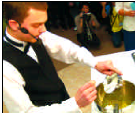
4. Whip up your signature beverage 4. Cree su preparacion de autor